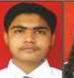
CASH PHYSICS - 95