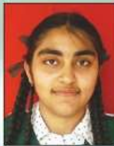
HANISHA FIT - 100, SOCIAL STUDIES - 99